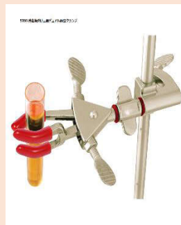
三指自在クランプ