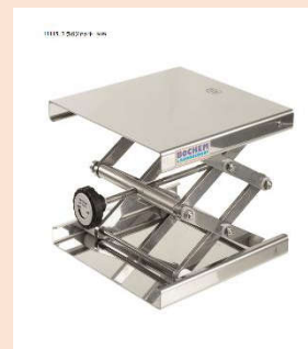
11130 ラボリフ SUS18/10