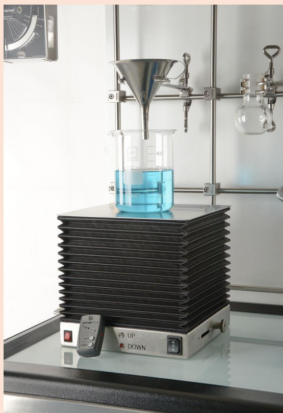
11220 ラボリフト 18/10 SUS 240x240mm