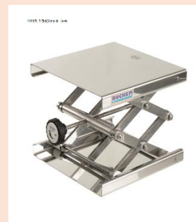
11130 ラボリフ SUS18/10

ゆれが少ない上下運動！ 指に優しい折り曲げデザイン！ オートクレーブ対応あります。