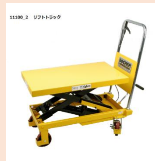
リフトトラック油圧 300Kg (油圧式モデル変更中)