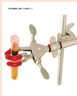
三指自在クランプ